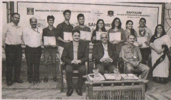
Winners of the debate contest with guests from MRPL and Sahyadri College